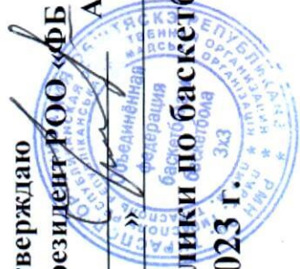
Таблица результатов Кубка Приднестровской Молдавской Республики по баскетболу среди мужских команд, сезон 2023/2024 гг. 09-13.10.2023 г.